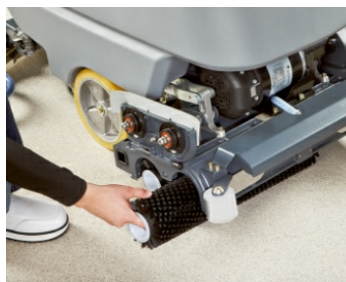
Version à brosse cylindrique ou brosse à plat : la machine peut être équipée de différents systèmes de brosses selon les salissures à éliminer. Un tamis à déchets intégré dans le bac permet de collecter les saletés les plus grosses. Les brosses peuvent être remplacées rapidement sans aucun outil.